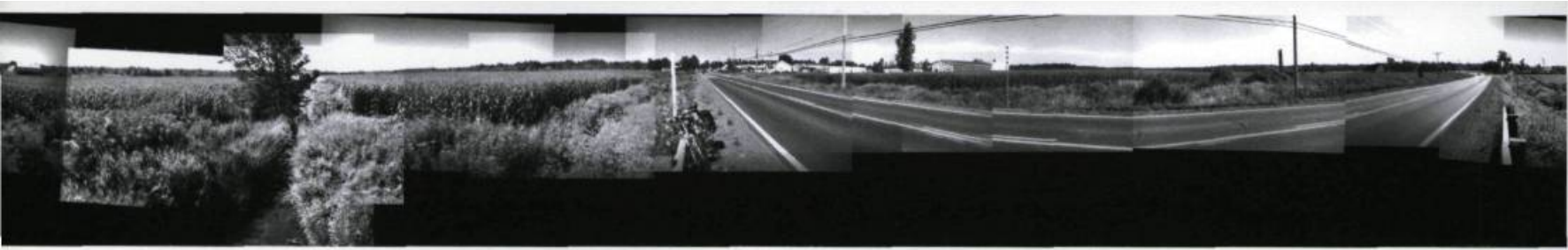
JULIE LAPALME, Tapis à langues , 2002. LA-6 [N45°27'48" O-72°43'14"] Détail du site Web autour du ruisseau Lapalme.

corps allongé est projetée la vidéo d'une femme nue qui s'enfonce dans la graisse comme dans l'eau du bain pourtant inexistante. Si le visiteur laisse passer le temps, il verra ce corps adipeux suinter. Des gouttelettes perlent et glissent sur la surface de graisse. Il ne faut pas se méprendre, ce corps ne fond pas sous l'effet de la chaleur ambiante, mais bien parce qu'une communauté virtuelle, invisible dans le lieu où le corps est exposé, participe à sa disparition.