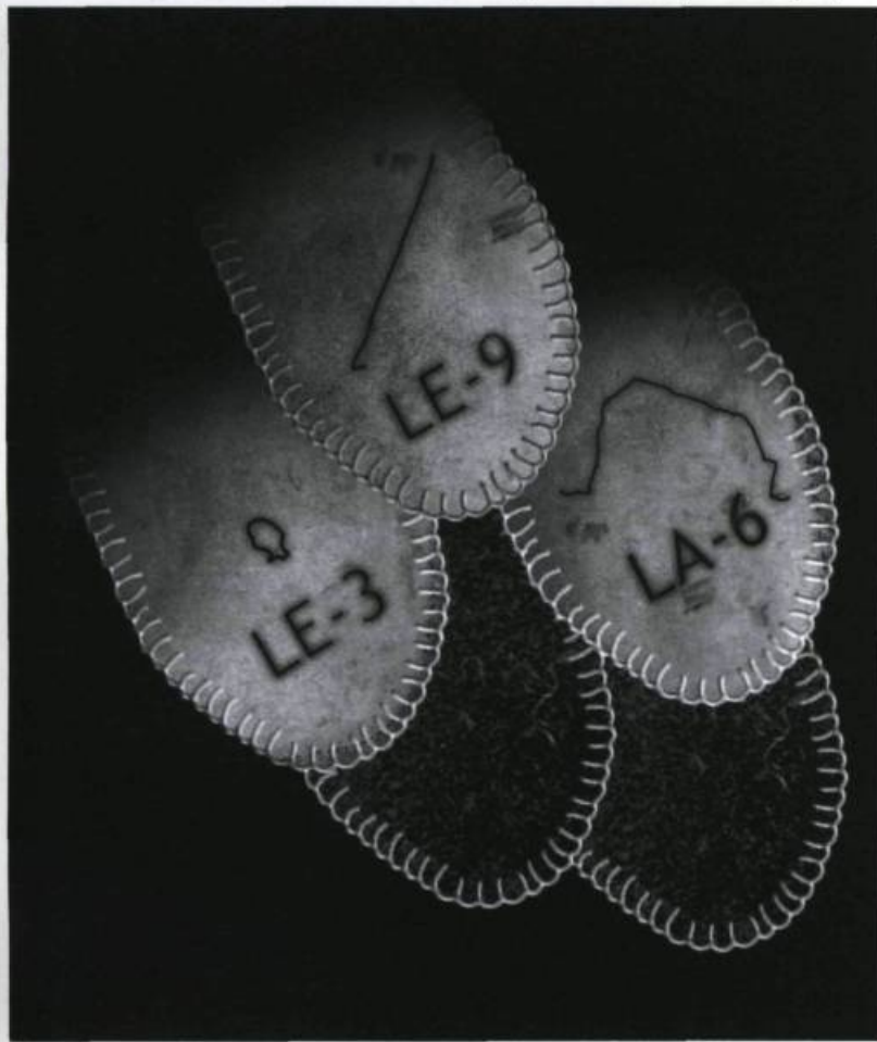
JULIE LAPALME, Tapis à langues , 2002