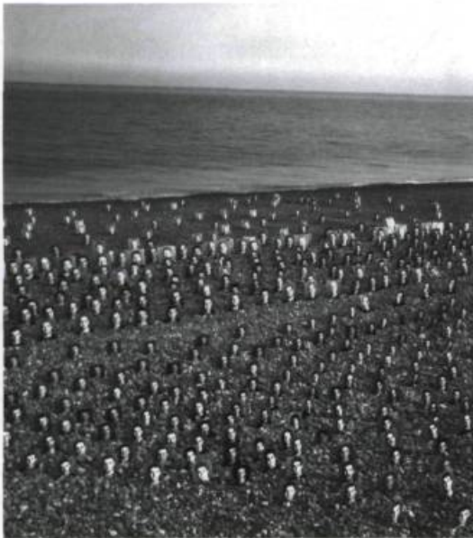
BERTRAND CARRIÈRE, Jubilee , 2002. Installation.

Le corps social est un projet complexe qui, à première vue, semble très proche d'une installation conventionnelle en galerie. Dans sa plus récente version, développée dans le cadre du projet Ancrage du Vidéographe, un corps de femme grandeur nature, modelé de graisse blanche, est étendu dans une baignoire d'acier. Sur ce